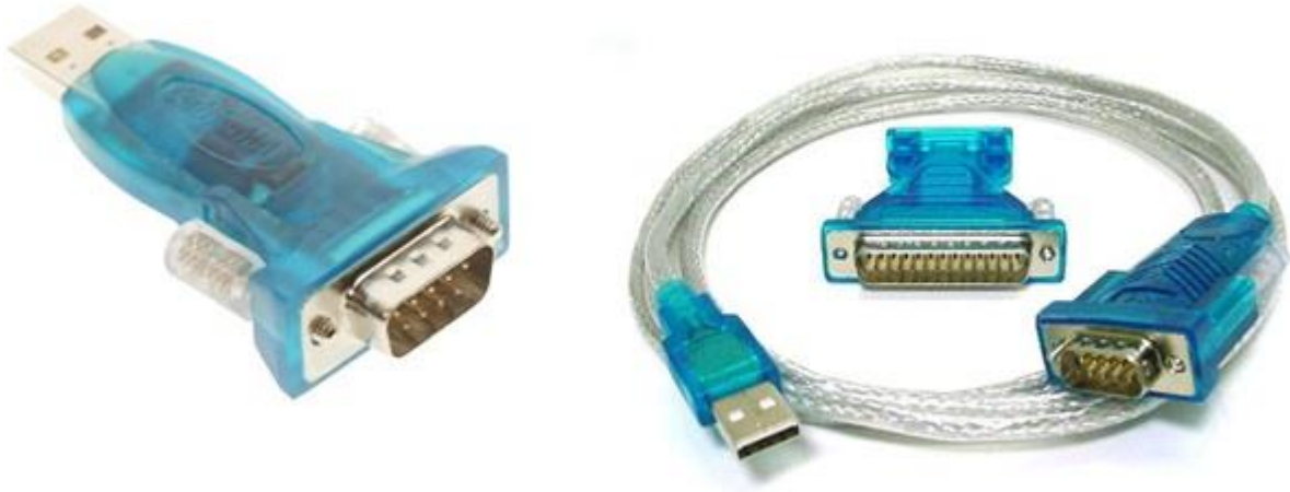
مبدل های USB به RS232